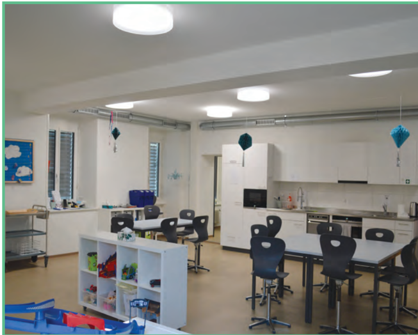
Le local pour l'accueil parascolaire créé à l'emplacement de l'ancienne administration communale.