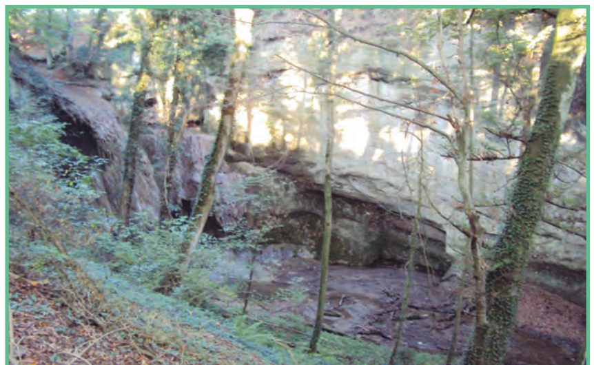
Creux de sel sur les hauts du village

Derrière-chez-Chappuis, Au Clos à Pugin,