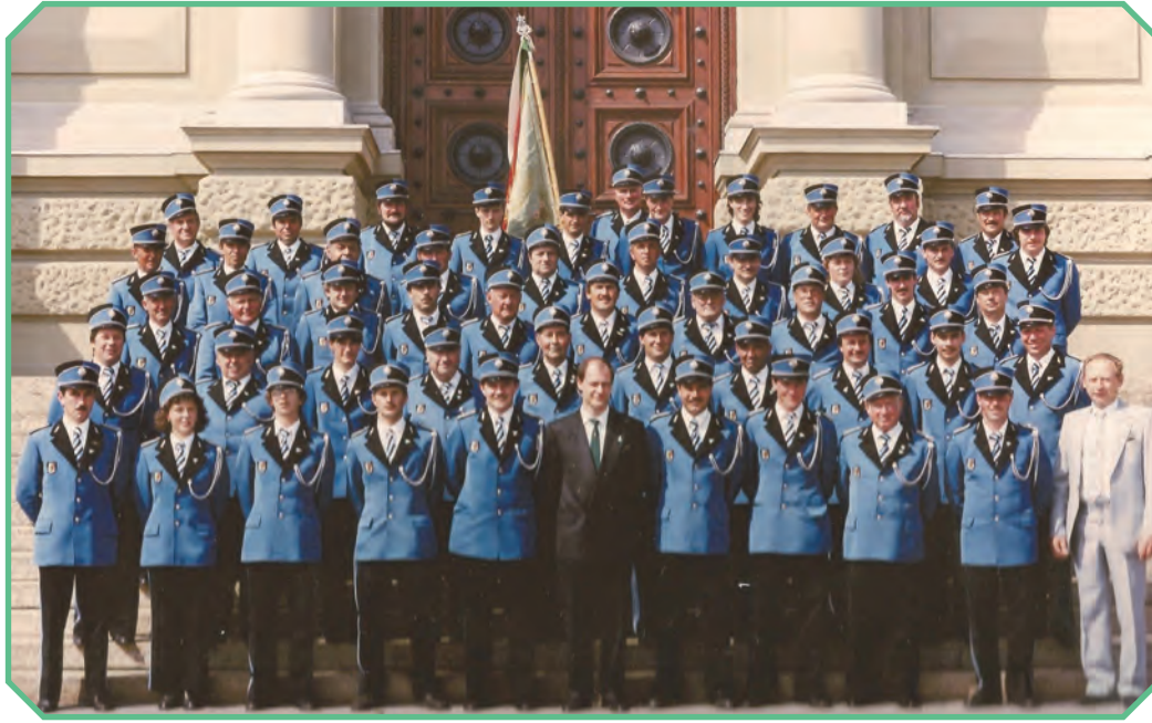
La société de la Lyre en 1992

La société de musique « La Lyre » de Corcelles-près-Payerne a été fondée le 17 mars 1921.