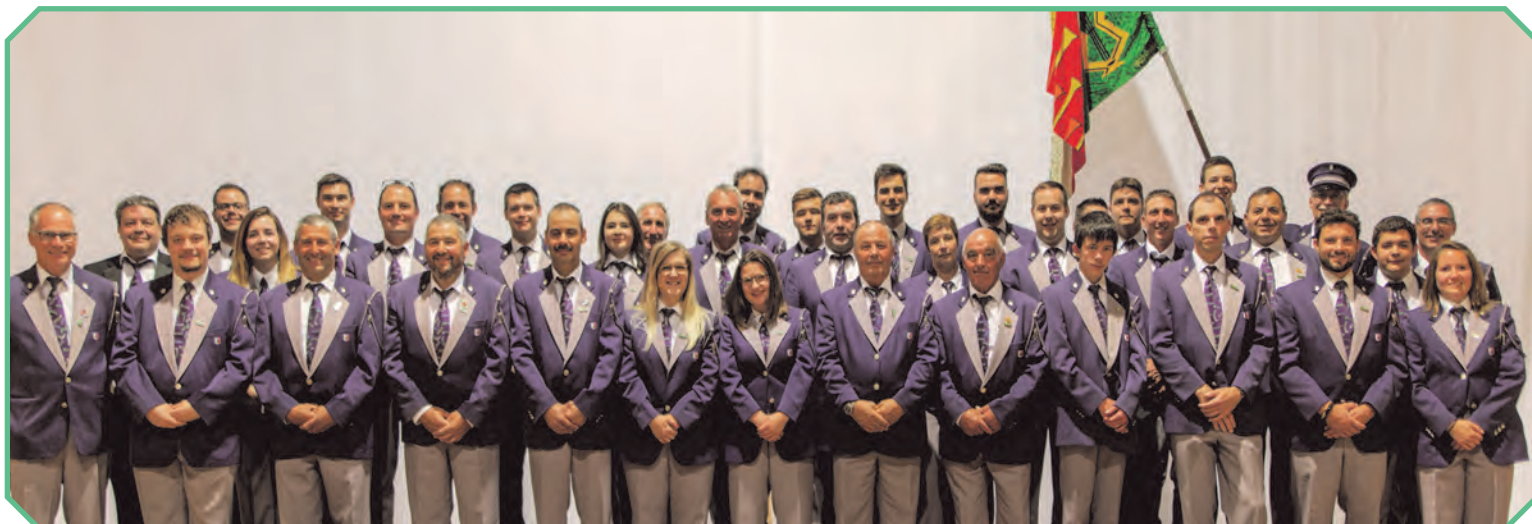
La société en 2020