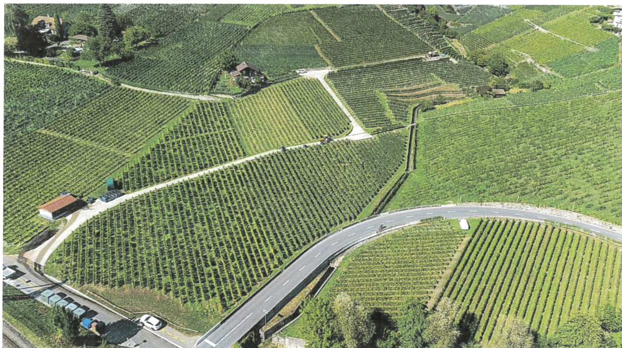
La Baume et Villette à Lutry