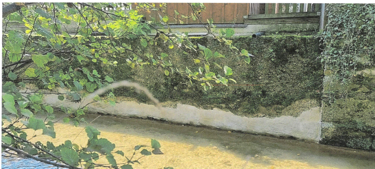
Réfection du mur dans le secteur Clos-à-Pugin

Au niveau des autres cours d'eau, nous intervenons généralement en fin d'hiver pour un élagage des haies qui les longent, afin que leur emprise reste dans le gabarit prévu et n'empiète pas sur les parcelles adjacentes, qu'elles soient du domaine public ou privé.