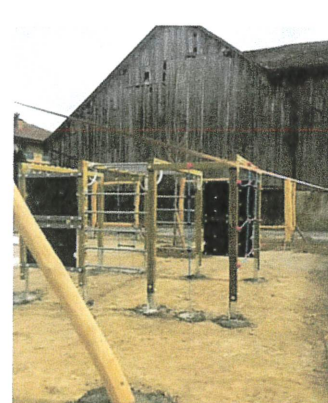
Réfection de la place de jeux à la Rue des Moulins

44.311 : Diverses fournitures, achats de jeux et travaux d'aménagements de la place à la Rue des Moulins reconstruite à neuf en 2022.