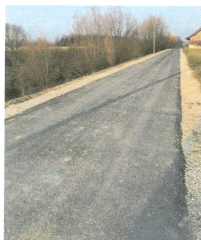
Réfections de la route du Sansui et du chemin AF de la Grange de la Ville