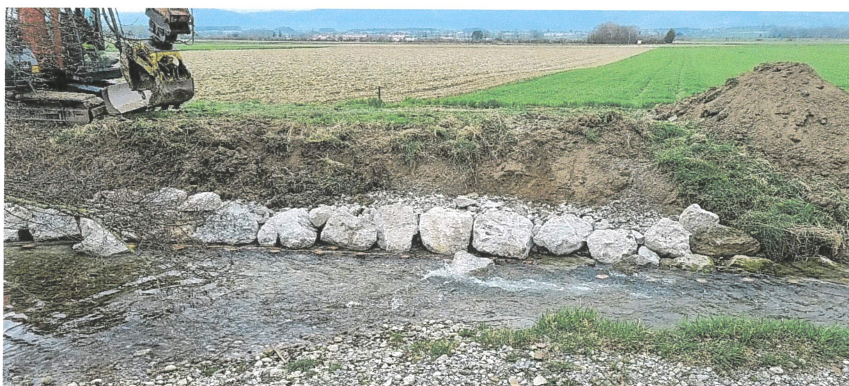
Travaux dans le secteur du Bornalet

Sur le secteur du ruisseau du Motélon, des arbres ont été déracinés à proximité de la route RC601. Deux arbres ont dû être abattus pour sécuriser le trafic routier et la rive a dû être consolidée à cet endroit. Une coupe préventive a été effectuée sur des arbres le long de la route cantonale.