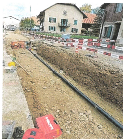
Travaux de mise en séparatif, changement de conduite d'eau potable et aménagement de la super structure Rue Vers-chez-Cherbuin.