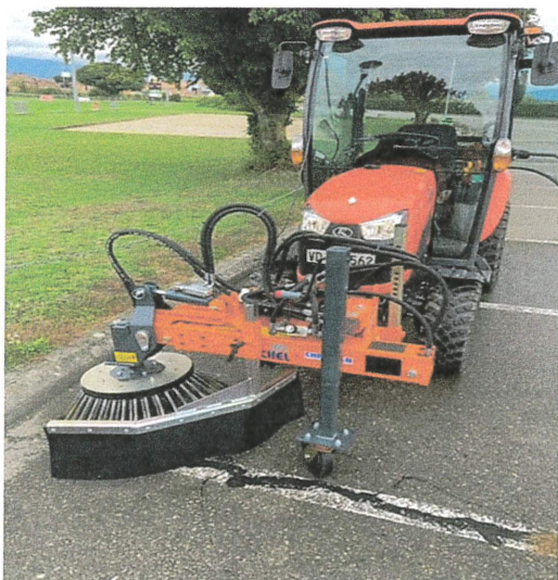
Achat d'un tracteur Kubota

Le remplacement de notre petit tracteur Kubota par un modèle plus puissant nous apporte toute la satisfaction espérée. Nous avons pu l'équiper d'une épareuse de bord de route, d'une brosse de désherbage et d'un disque pour gérer les bords de banquettes herbées.